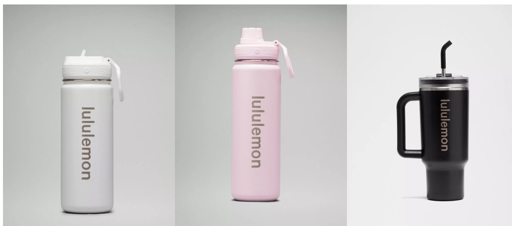
Back to Life Sport Bottle 18oz Straw Lid : White