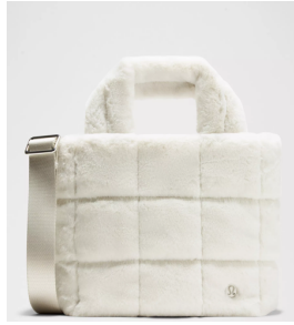
Quilted Grid Tote Bag Mini 5L Plush Fleece ¥17,800