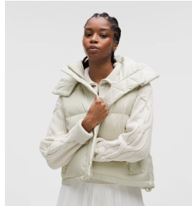
Wunder Puff クロップベスト ¥31,800

人気の定番アイテムをはじめ、寒い冬に活躍する高機能アウターも勢ぞろい。ホリデーシーズンに向けて、快適な着心地、気分が盛り上がるヘルシーなギフトを提案しています。メンズ、ウィメンズはもちろん、ユニセックスで楽しめるユニークなアイテムがきっと見つかるはずです。