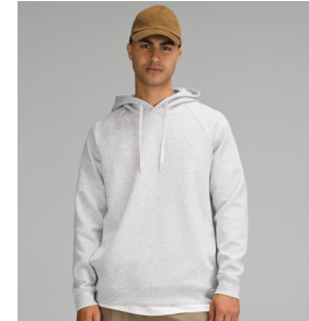
Smooth Spacer プルオーバーフーディ ¥18,800